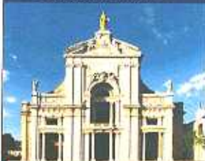
Basilica Santa Maria d. Angeli