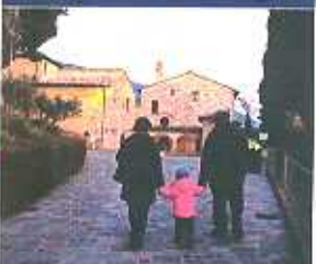
Mostra: I Luoghi dello Spirito