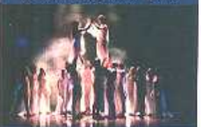
Musical: Chiara di Dio