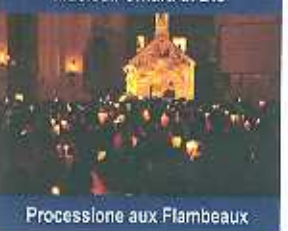
Processione aux Flambeaux